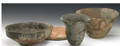
Abb. 7 Michelsberger Keramik vom Kapellenberg (Sammlung Rolf Kubon)