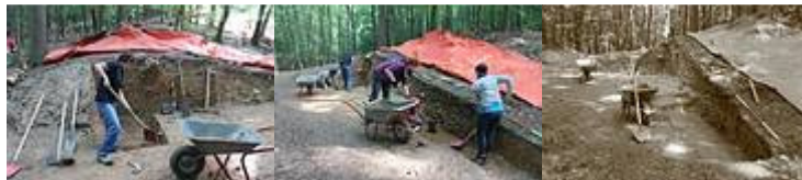
Abb. 3, 4, 5 Ausgrabungsarbeiten am Kapellenberg bei Hofheim/Ts. im August 2012