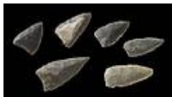
Abb. 2 Jungsteinzeitliche Pfeilspitzen (ca. 4000 v. Chr.)